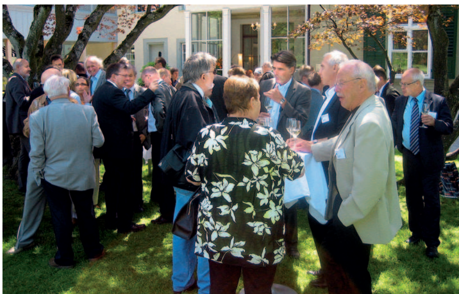
Angeregte Diskussionen nach der Versammlung im Garten der sorgfältig renovierten Villa Schöngrün neben dem Zentrum Paul Klee.

Die anschliessenden Führungen durch die Sammlung Paul Klee und die Wechselausstellung Max Beckmann – Traum des Lebens – öffnete die Augen für Zusammenhänge und Gegensätze in den Ausdrucksformen der beiden Zeitgenossen. Die Konferenz klang aus beim «Verre de l'amitié» im Garten des Erlacherhofs an der Junkerngasse, Sitz des Stadtpräsidiums und der Stadtkanzlei.